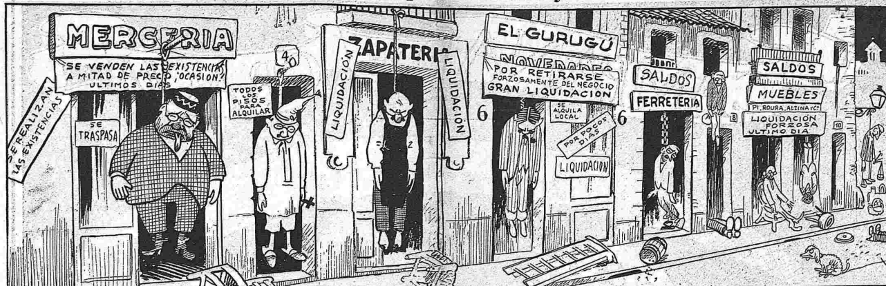
La situació econòmica de Barcelona va normalitzant-se.

Aquest número ha passat per la censura governativa. Esperem que aquesta setmana serà l'última