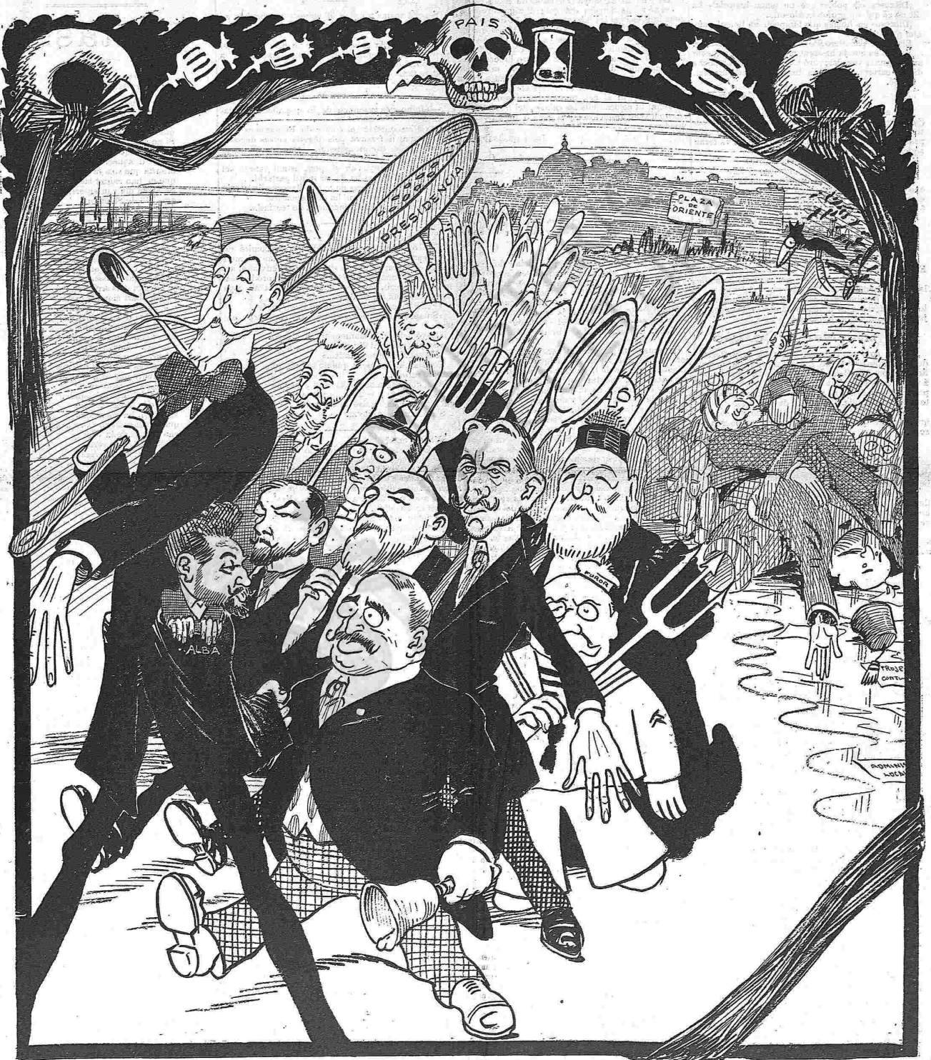
¡Moret se 'n va á la guerra, birondon birondon birondena!...