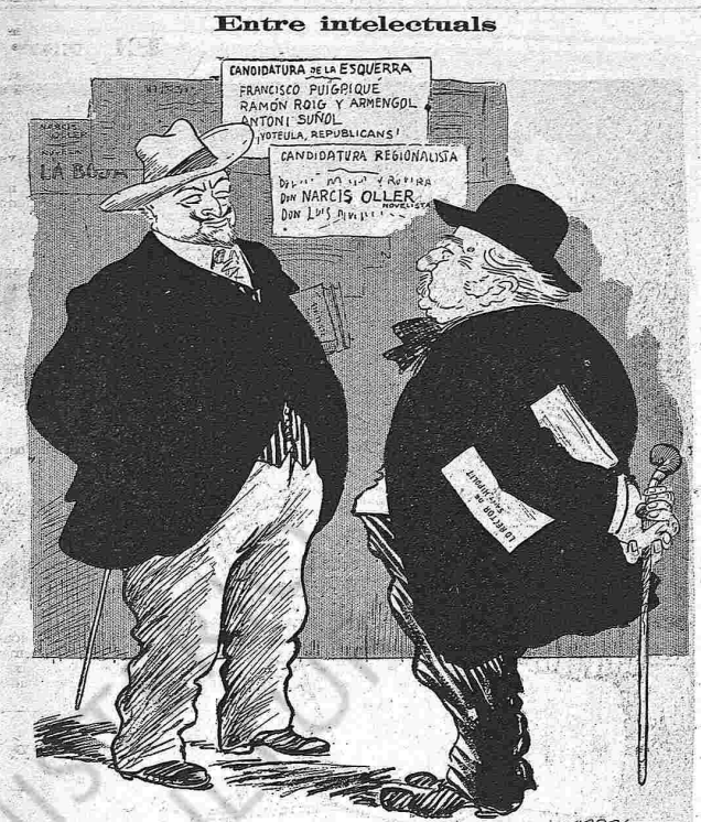
—¿Heu vist això de l'Oller? —Sí; diu que va a fer una segona edició de La bojeria .