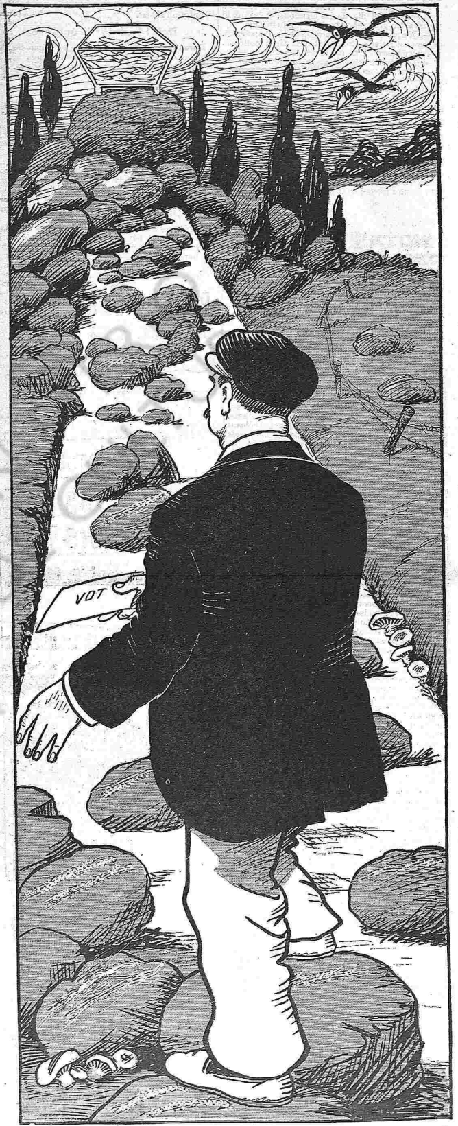
---El camí está ple d' obstacles, pero no importa ¡hi aniré!