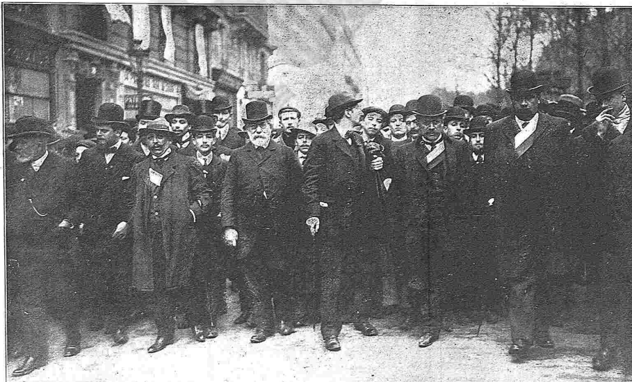
La manifestació de protesta, capitanjada pels diputats socialistas, se posa en marxa.