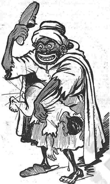
Inculcant la santetat per medi del sabatot.