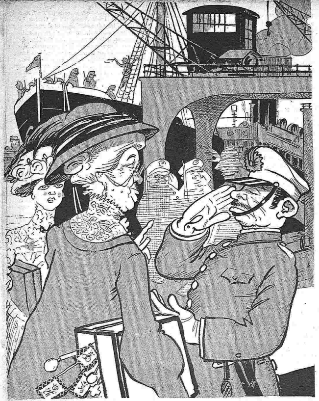
—Venía a repartir unas medallitas... —¡Pase V., señora!