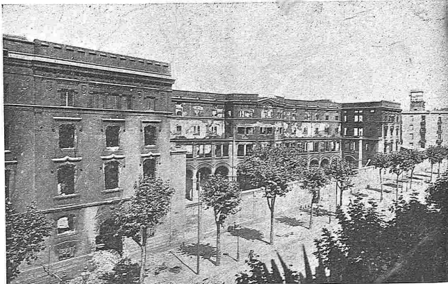
Aspecte del edifici dels Escolapios de Sant Antoni, després de la crema.