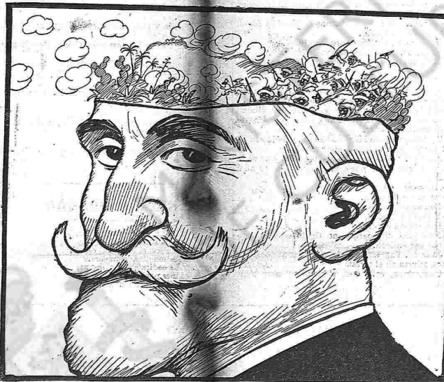
—Creguin, cavallers, que tinch un cap com uns tres quartans.