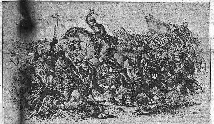
4 de Febrer de 1860.—Batalla de Tetuán.