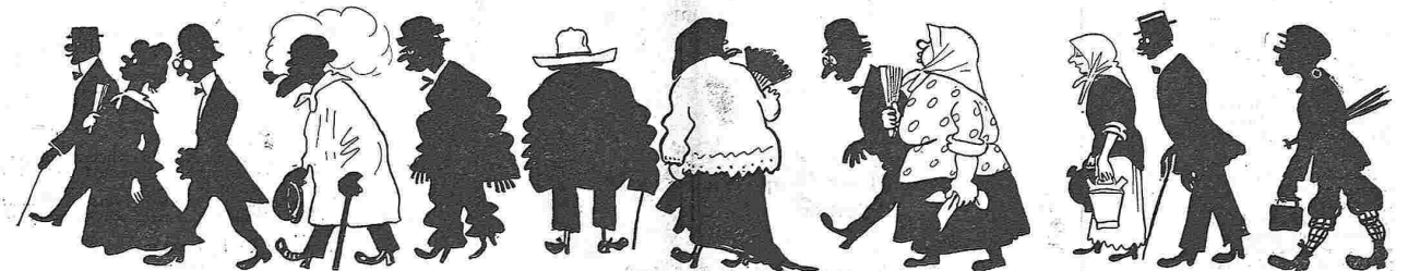
Durant la saragata. — Els que sortían.

Imprempta LA CAMPANA y LA ESQUELLA, carrer del Oim, número 8 Tinta Ch. Lorilleux y C.ª