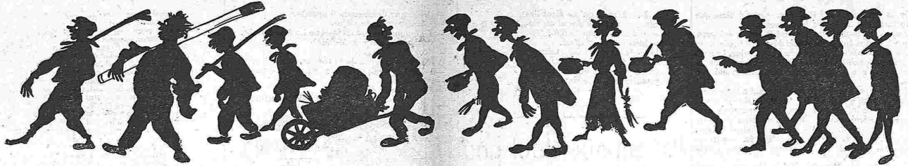
Durant la saragata. — Els qu' entravan.

Pobre cimbori, á l' altura en que 's troba, quin espectacle més trist ha degut presenciar aquesta díaa! Ab quina cara més espantada devia veure encucarimar las sevas sucursals.