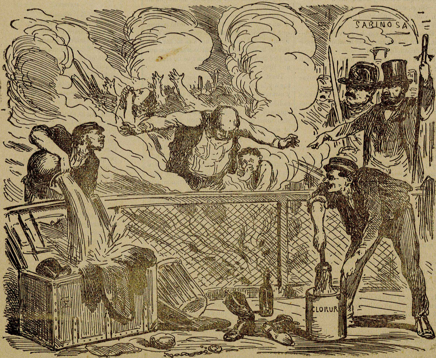
Los bárbaros de la Sabinosa.