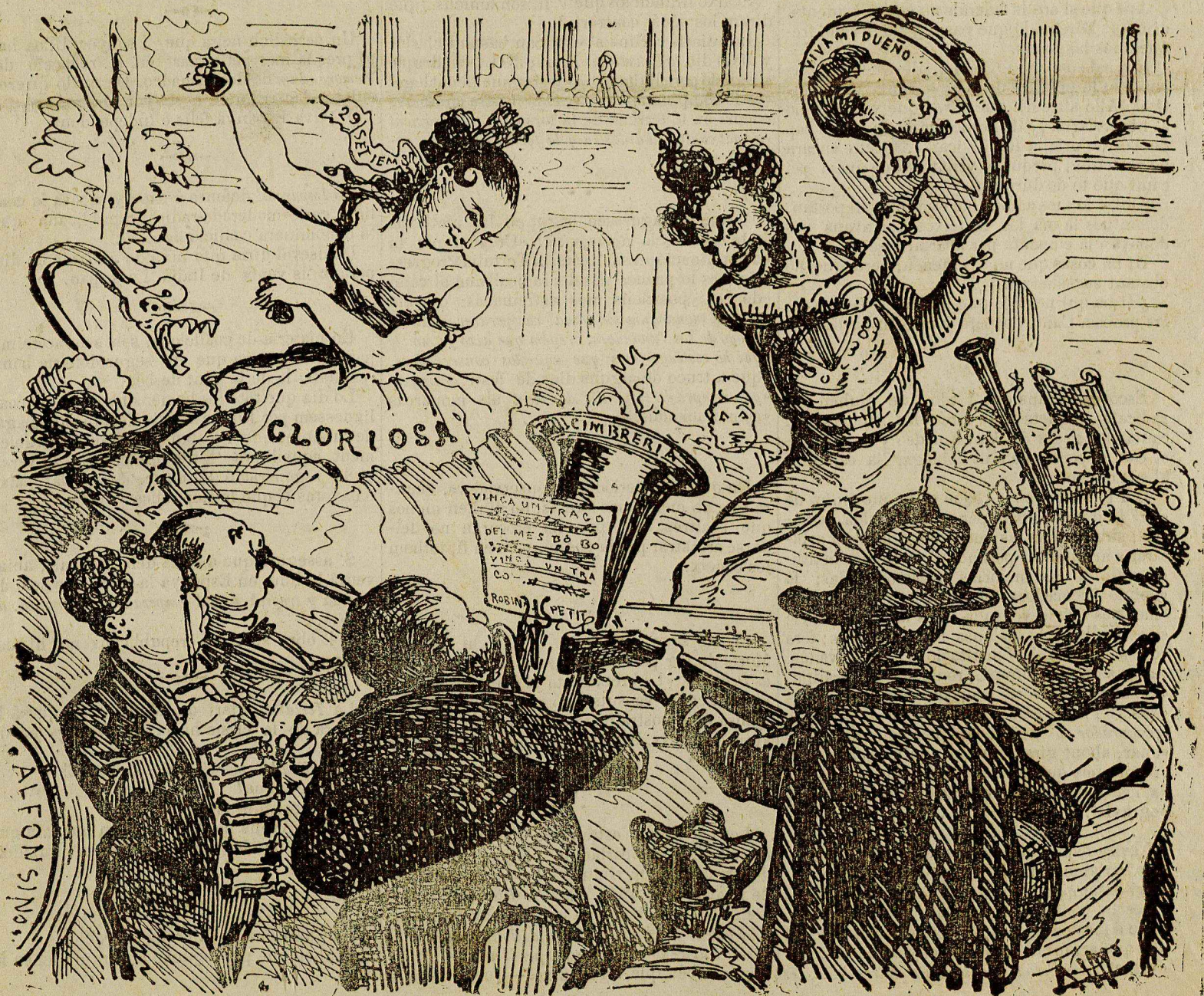
¡En buenas manos está el pandero!