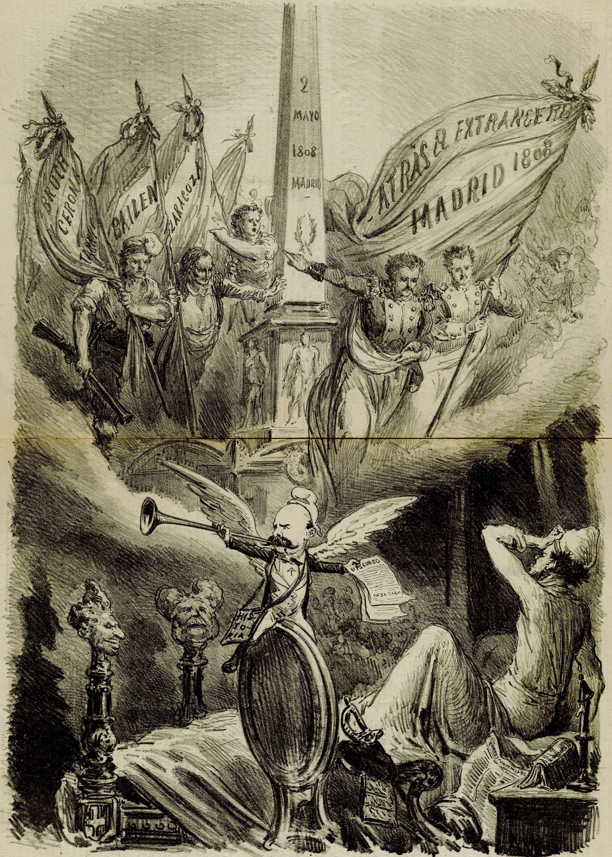
UN SOMNÍ REAL.